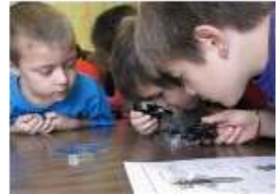
Identification de macroinvertébrés benthiques dans le cadre du projet J'adopte un cours

Ensemble, les partenaires investiront, en temps et en argent, une valeur de plus de 300 000 $ sur trois ans. Une somme de 195 000 $ a déjà été amassée, en grande partie via la participation du FJAT à hauteur de 175 000 $. Des sommes doivent encore être trouvées dans le milieu régional afin d'assurer le financement d'outils pédagogiques. En plus d'impliquer et de sensibiliser les jeunes à l'environnement aquatique, ces sommes permettront d'outiller les professeurs et les intervenants. Ils pourront ainsi offrir aux jeunes des expériences concrètes en lien avec la biologie et l'écologie, leur donner l'occasion de travailler en équipe et de mener à bien un projet. Les jeunes participeront donc à l'avancement des connaissances sur l'état de l'eau dans la région. Finalement, cette initiative donnera l'opportunité aux jeunes de partager leurs connaissances avec la communauté, afin de sensibiliser celle-ci aux différents impacts que peuvent engendrer la pollution et la mauvaise gestion de l'eau.