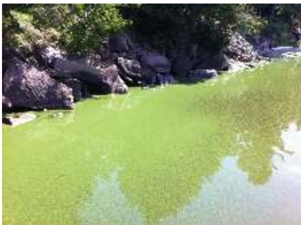
Lac Témiscamingue, septembre 2012