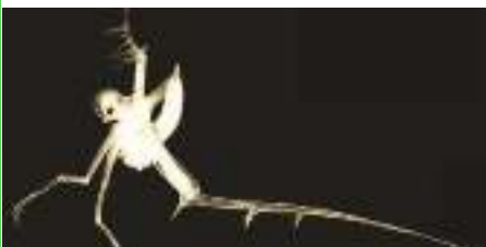
Puce d'eau en hameçon