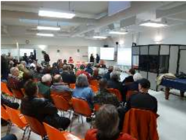
Une centaine de personnes ont participé à la réunion publique d'avril sur le Plan de gestion du lac Kipawa

Pouvons-nous développer le lac Kipawa tout en préservant sa qualité? C'est justement la question qui sera évaluée au cours de ce processus.