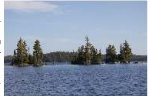
Le lac Kipawa

L'OBVT a été mandaté par la MRC de Témiscamingue, pour réaliser en étroite collaboration avec elle, le Plan de gestion concertée du lac Kipawa qui devra être achevé en janvier 2014 et être approuvé par le MRN par la suite. Il repose sur un portrait des enjeux du territoire issu de la littérature et des experts sur le sujet et il est complété par une consultation du milieu sur l'avenir que devrait avoir le lac. Cela permettra de produire un document adapté au milieu.